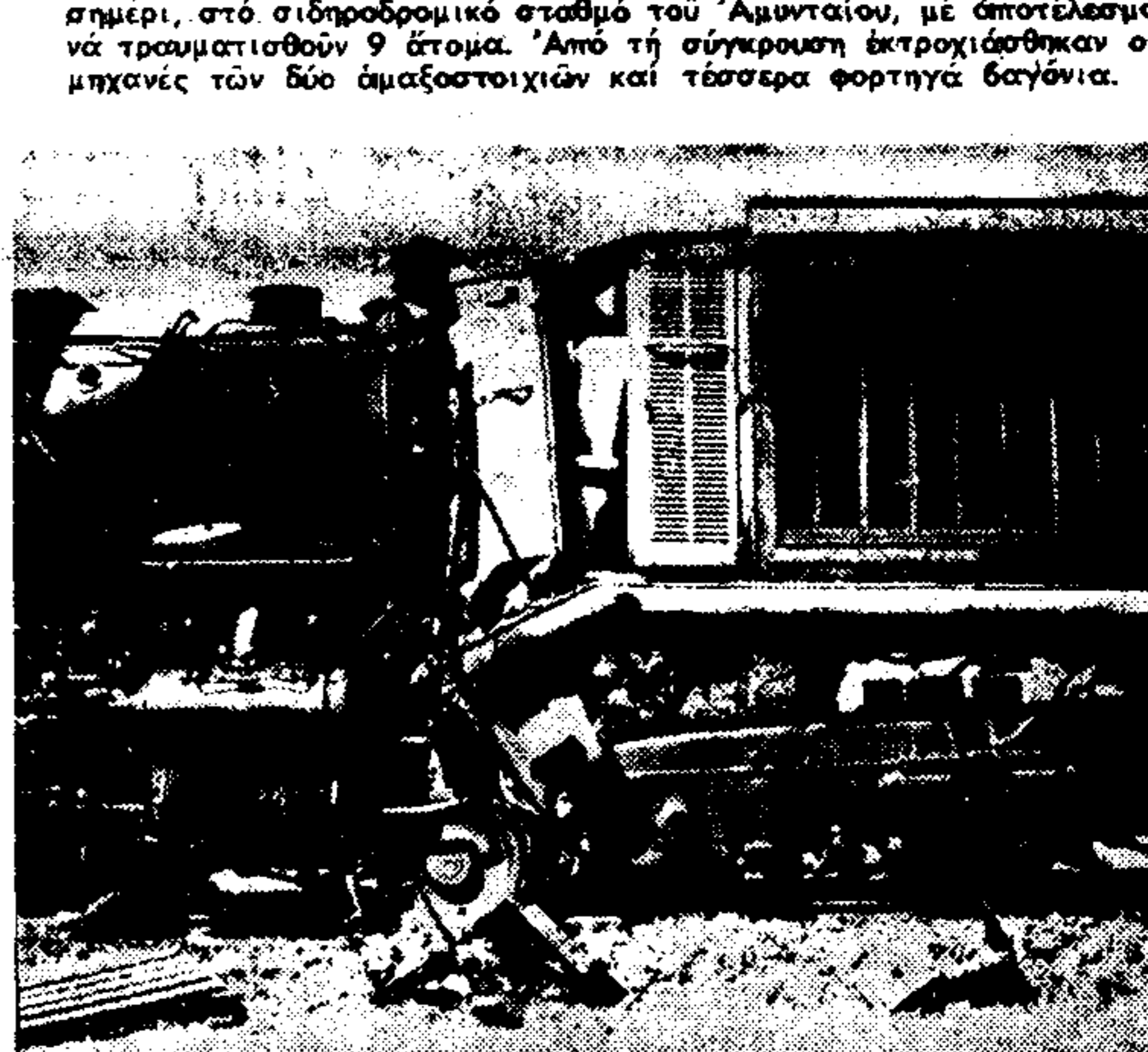
Μία τηλεοπτική εικόνα από τό σύγκρουση.